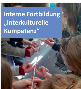
Interne Fortbildung „Interkulturelle Kompetenz“