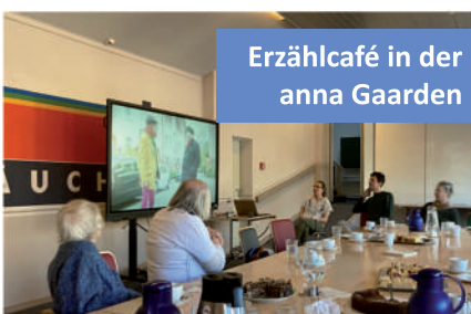
Erzählcafé in der Anna Gaarden