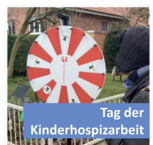
Tag der Kinderhospizarbeit