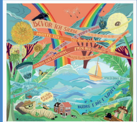
Verwirklicht von der Kieler Künstlerin Sara Pütter