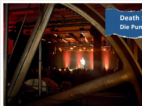
Death Slam Die Pumpe