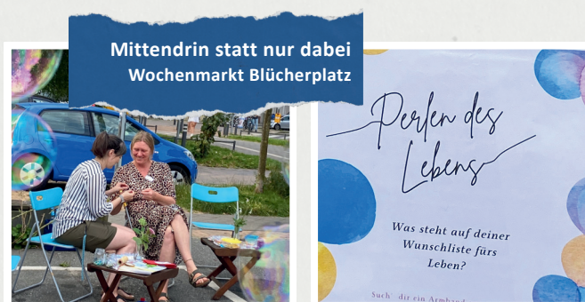
Mittendrin statt nur dabei Wochenmarkt Blücherplatz