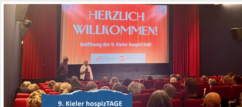
9. Kieler hospizTAGE im Kieler Stadtgebiet