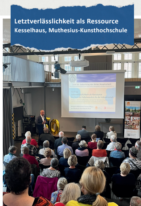
Letztverlässlichkeit als Ressource Kesselhaus, Muthesius-Kunsthochschule