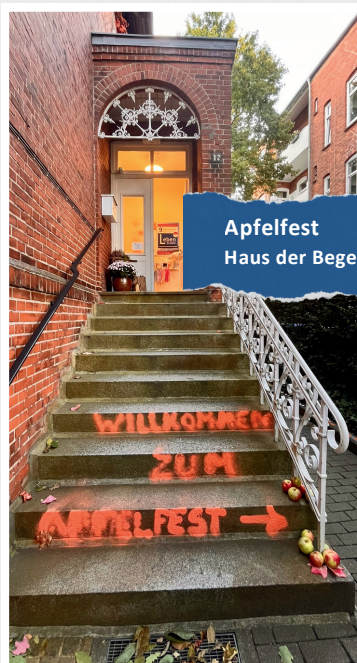
Apfelfest Haus der Begegnung